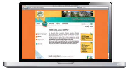
D'un Foyer rural : www.foyersruralsaintrestitut.fr