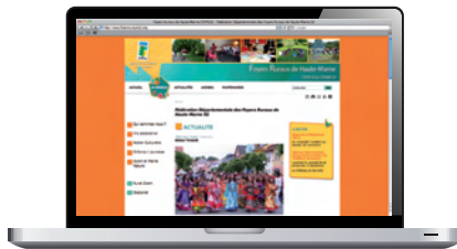
D'une Fédération départementale : www.foyersruraux52.org