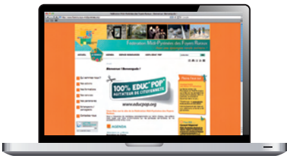
Exemple d'un site d'une Union régionale : www.foyersruraux-midipyrenees.org

Voir le site de démonstration : www.frdemo.fnfr.org