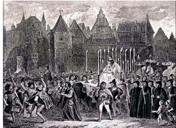
Des comédiens ecclésiastes interprétant une Fête des Fous

Nous avons déjà eu l'occasion, il y a plusieurs années, de travailler sur la pratique en amateur avec la FNCC. Il y a de la bonne volonté de part et d'autre. Mais la difficulté consiste en la traduction concrète et locale d'une réflexion et d'une entente nationales. De manière générale, les élus sont aujourd'hui conscients de l'utilité du travail des associations culturelles. La question est de savoir comment convertir cette conviction en actes. C'est d'autant plus difficile que le milieu associatif peut avoir tendance à rester fermé sur lui-même. Si les municipalités doivent apporter leur soutien, il importe aussi que les associations comprennent que leurs projets peuvent et doivent nourrir la vie culturelle du territoire. Les amateurs ont certes des droits – notamment celui de pouvoir vivre leur pratique – mais ils ont aussi des devoirs, des devoirs d'artistes et de citoyens. Trop souvent les gens méconnaissent l'apport de leur travail pour l'intérêt général. ■