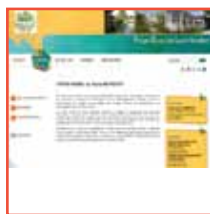
D'un Foyer rural : www.foyerruralsaintrestitut.fr