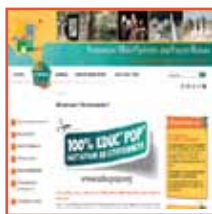
Exemple d'un site d'une Union régionale : www.foyersruraux-midi-pyrenees.org