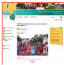
D'une Fédération départementale : www.foyersruraux52.org